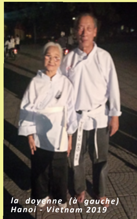
la doyenne (à gauche) Hanoi - Vietnam 2019