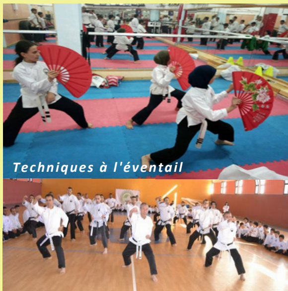
Techniques à l'éventail

LES DIFFERENTES FACONS DE PRATIQUER LE VIET VU DAO POUR LES JUNIORS - ADULTES - SENIORS TECHNIQUE TRADITIONNELLE - ARTISTIQUE - MANIEMENT D'ARMES (BÂTON, SABRE, FLEAU) COMBATS MAINS NUES - SELF-DEFENSE - COMBATS SUR RING - COMPETITIONS GYMNIQUE SENIORS VU TAI CHI - JUNIORS VU DAO A PARTIR DE 5 - 7 ANS*